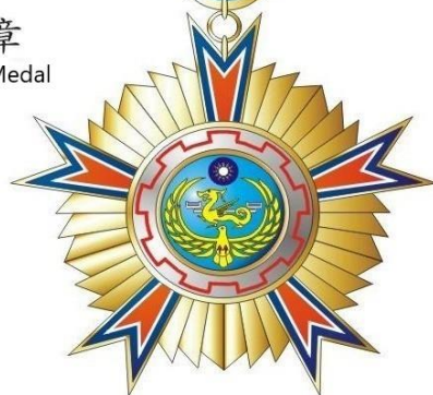
二等海巡專業獎章 Second Class Coast Guard Profession Medal