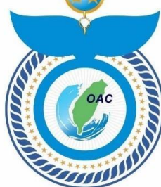
一等海育專業獎章 First Class Ocean Conservation Profession Medal