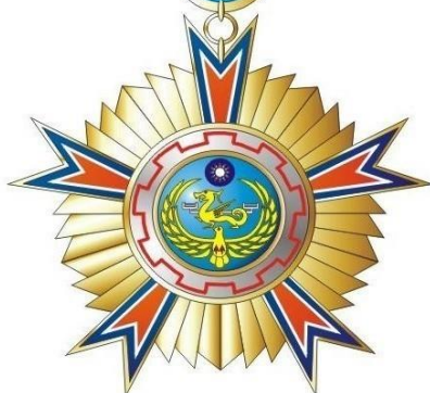
一等海巡專業獎章 First Class Coast Guard Profession Medal