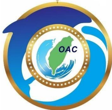
三等海洋專業獎章

Third Class Ocean Affairs Profession Medal