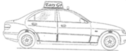
計程車車頂廣告看板三視尺寸圖